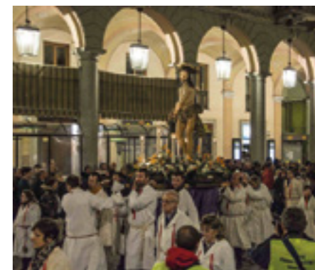
sopra La "cassa" durante la processione [2016]