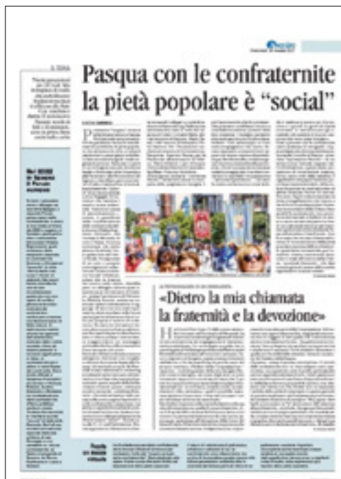
sopra "Avvenire" del 31 marzo 2021, pag. 17

Nel numero in edicola il 31 marzo scorso il quotidiano "Avvenire" – organo di informazione della C.E.I. – ha dedicato un'intera pagina (la n° 17) alle nostre Confraternite. Essa è consultabile in versione integrale sul nostro sito web mediante il link: https://bit.ly/2PR2ogg , tuttavia pensiamo sia importante darne qui una sommaria illustrazione per tutti coloro che non dispongono di idonei strumenti informatici. L'articolo di apertura, in "taglio alto", è titolato con grande efficacia «Pasqua con le confraternite; la pietà popolare è 'social'». Il servizio è a firma