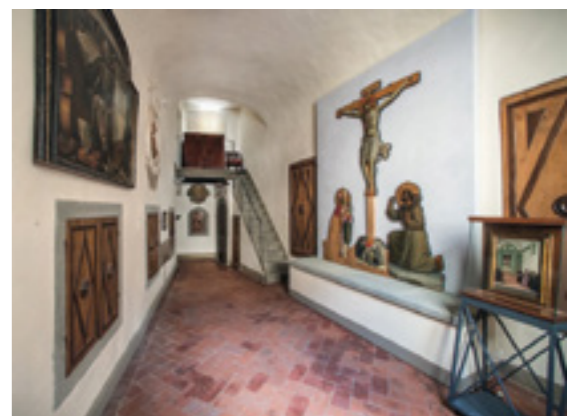
sopra La Sagrestia di San Niccolò del Ceppo col Crocifisso del Beato Angelico

Il prezioso ambiente espressione della cultura fiorentina del tardo Settecento accoglie anche il rarissimo San Girolamo in terracotta del 1454 legato ai Girolamini di Fiesole e ad Andrea del Castagno, due tavole di Jacopo da Empoli, La prima messa di San Filippo Benizi di Jacopo Vignali, tele di Baccio del Bianco.