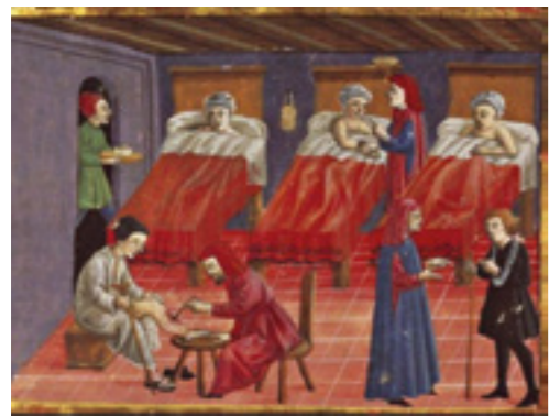
sopra L'assistenza ospedaliera delle Confraternite [tavola sec. XIV]

del Tuir, spetta nella misura del 90%. Le opere devono essere realizzate su edifici che si trovano nelle zone sismiche ad alta pericolosità (cfr l'ordinanza del Presidente del Consiglio dei ministri n. 3274 del 20 marzo 2003 e la mappa sismica aggiornata al 2020).