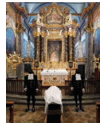
sopra L'allestimento del 'Mortorio'

Quest'anno non potendo svolgere la consueta processione, il 30 marzo - Martedì Santo - noi confratelli abbiamo voluto una S. Messa all'interno della Confraternita, allestendo la chiesa con alcune macchine processionali e abiti utilizzati durante la processione. L'intento era almeno di rievocare la tradizionale processione, ancora molto partecipata dalla popolazione di Villafalletto. Inoltre, grazie all'appoggio di una radio locale, siamo riusciti a creare una diretta Facebook per poter raggiungere tutti i fedeli, che si sono uniti a noi da casa.