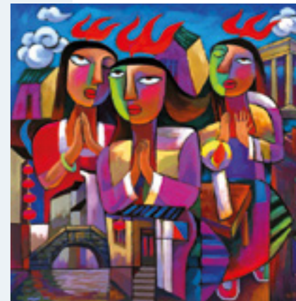
sopra He Qi - Pentecoste [sec. XX]