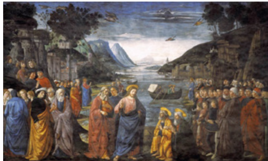
sopra Domenico Ghirlandaio - La chiamata degli Apostoli [1481]

Fenomeno quasi sconosciuto, dunque, ma quanto mai prezioso in un'epoca in cui le vocazioni scarseggiano. E non è un caso se nelle Diocesi italiane oggi si stia riscoprendo ed elogiando sempre più il valore delle Confraternite, sia per motivi di oggettiva evidenza e sia per il grande impul-