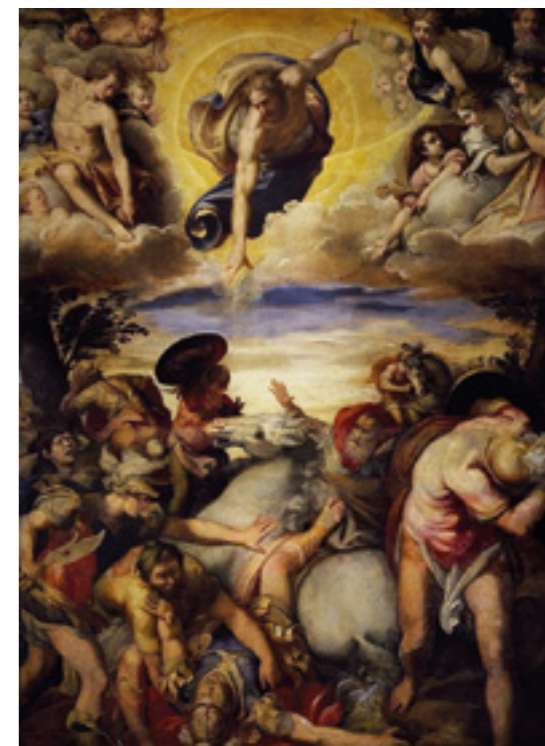
sopra Taddeo Zuccari - Conversione di san Paolo [1564-1566]