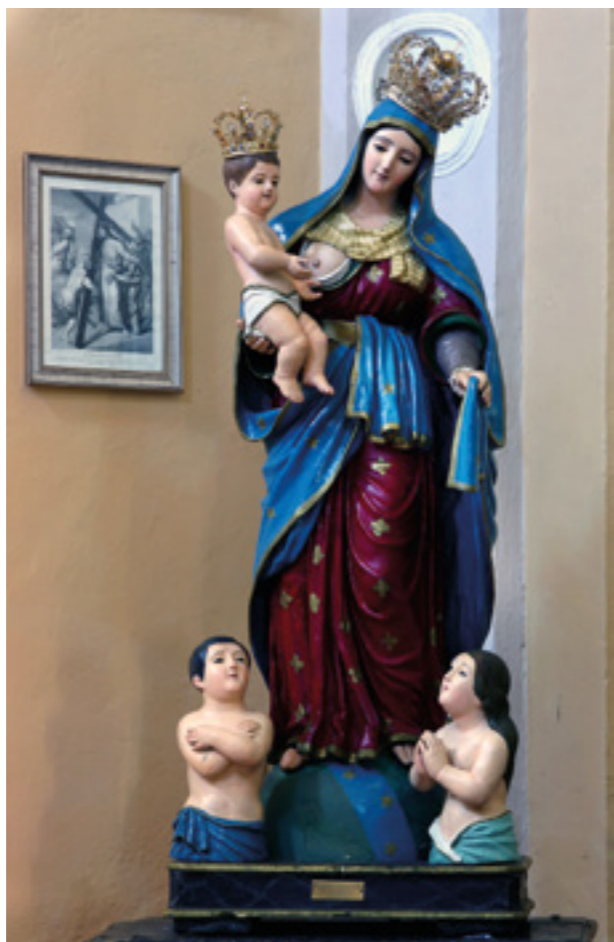
a destra La Madonna della Misericordia

Sammartinese, hanno sempre spinto la popolazione ad affidarsi all'intervento della Madonna così come un bambino inerme si consegna alle cure sollecite della madre.