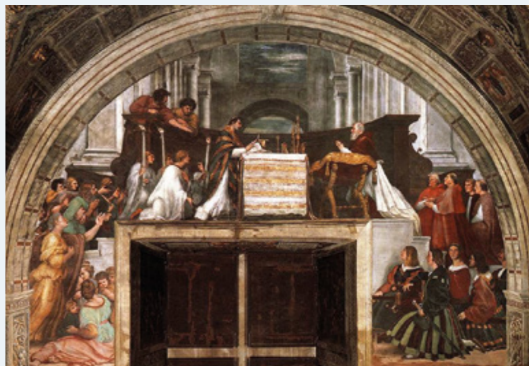
a sinistra Raffaello Sanzio - La Messa di Bolsena [Stanza detta di Eliodoro, Stanze Vaticane - 1512]