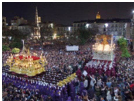
sopra Riti della Settimana Santa

Un derecho importante de los laicos católicos es la libre fundación de asociaciones con fines de amor o de piedad, así como para la animación de la vocación cristiana en el mundo. Los fieles están unidos desde hace siglos en fraternidades, asociaciones y obras de piedad. Tanto el Código de Derecho Canónico de 1917 como el Código de Juan Pablo II de 1983 han garantizado este derecho. En los tiempos modernos ha surgido un nuevo fenómeno que son los movimientos eclesiales. La práctica pastoral de la Iglesia subraya que son un importante entorno formativo para los fieles. Actualmente, casi dos millones de católicos polacos participan en ellas. Muchos de los miembros de estas organizaciones aportan una valiosa contribución a la vida de la Iglesia y a la comunidad laica. La cultura medieval francesa contribuyó al desarrollo de las cofradías en Polonia en los siglos XII y XIII porque, al haber alcanzado un alto nivel de desarrollo, ejerció una poderosa influencia en los círculos extranjeros, difundiéndose por toda la Europa cristiana. Ya en el siglo XI se mencionan las huellas de las actividades de las Hermandades Occidentales en Polonia. Algunos datos se encuentran, por ejemplo, en una carta enviada en 1089 por