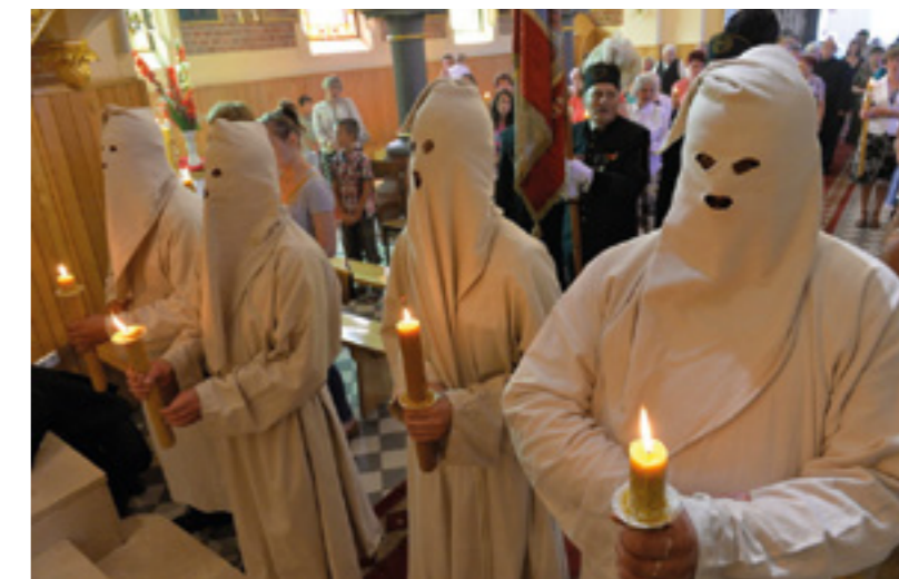
sopra Fraternità di Santa Maria Maddalena

Un des droits importants des laïcs catholiques est la libre fondation d'associations à des fins de charité ou de piété ainsi que pour l'animation de la vocation chrétienne dans le monde. Les fidèles sont unis depuis des siècles dans des fraternités, des associations et des œuvres pieuses. Le Code de droit canonique de 1917 et le Code de