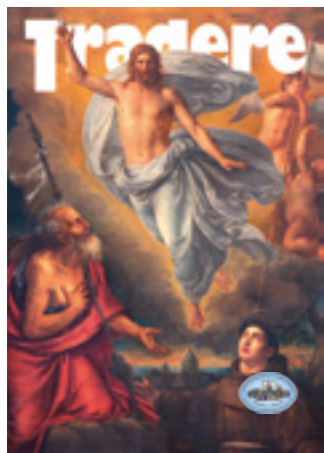
Catania, Sicilia: Il dipinto della Vergine Maria (Vergine Maria Corredentrice) nel Duomo di Emanuele di Giovanni (1961)