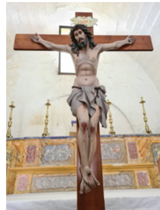
sopra Statua del Cristo Spirante