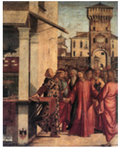
sopra Vittore Carpaccio - Vocazione di san Matteo [1502]

Se è facile pronunciare un “SI” al momento dell'adesione alla Confraternita e allo Statuto, bisogna poi dimostrarlo nei fatti, con un impegno quotidiano, con una fede salda, con la correzione fraterna e con una testimonianza evangelica, che trae forza dall'esempio e dal carisma del santo a cui è dedicata la Confraternita. Grazie a questi principi, di cui sono debitore alla Congregazione a cui appartengo già da 7 anni, ho potuto maturare la scelta vocazionale, entrando in Seminario, per continuare il cammino di discernimento, che non può prescindere dalla relazione con gli altri e con Dio.