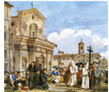
sotto Achille Pinelli [1834] - Confraternita romana davanti alla chiesa