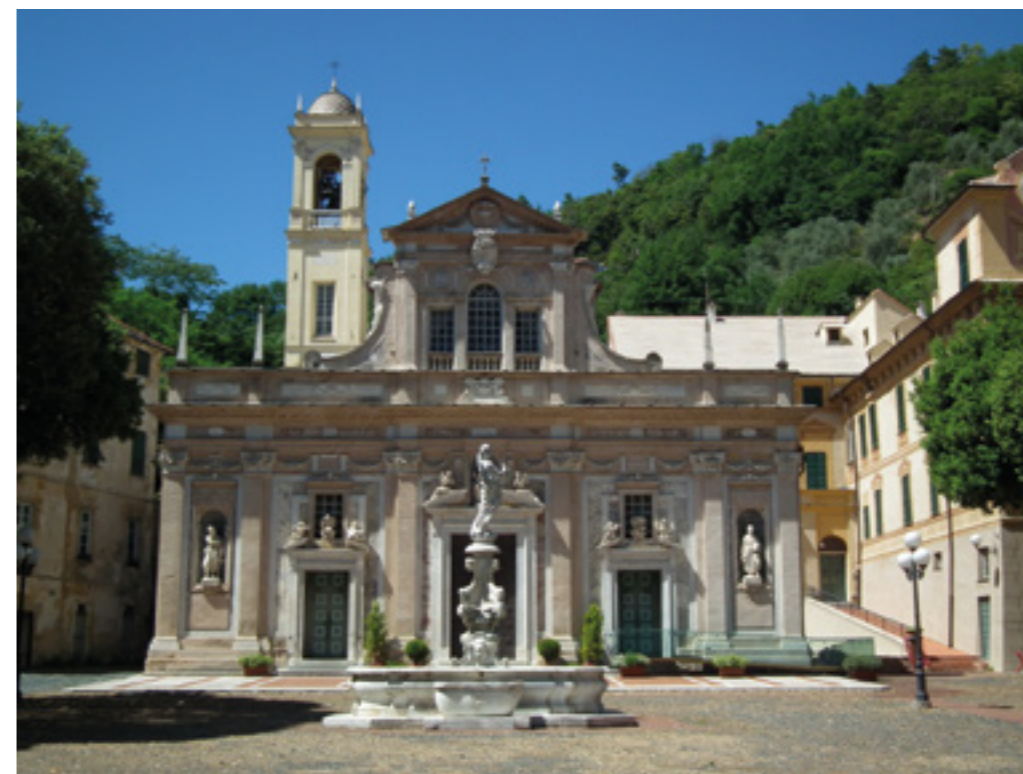
sotto Savona - Santuario di Nostra Signora della Misericordia e Santuario delle Confraternite italiane

Si precisa che non vi è alcuna legge o regolamento dell'ordinamento civile che obbliga alla soppressione delle Confraternite "quiescenti", infatti la circolare n.28 della CEI invita gli Ecc. mi Vescovi a vigilare e a fare ogni sforzo per ricostituire le Confraternite, che sono regolate dal C.D.C.