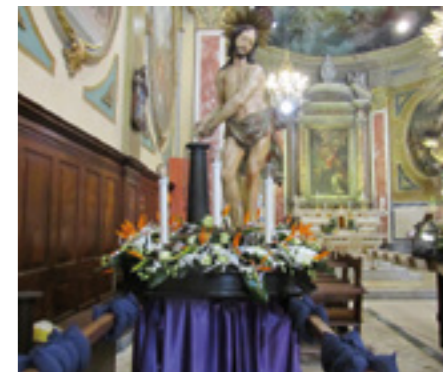
in alto La "cassa" del Cristo al Palo [2016]

La Diocesi di Savona non è nuova a iniziative prese in tempo di Covid. Già nel maggio 2020, undici Confraternite della Diocesi avevano accolto la proposta del Priorato Diocesano di offrire ceri votivi al Santuario di N.S. della Misericordia di Savona, il Santuario Nazionale delle Confraternite Italiane. Inoltre, la Confraternita di San Giovanni Battista di Cantalupo, Varazze, già a marzo si era adoperata per cucire 100 mascherine di stoffa da donare all'Ospedale San Paolo di Savona. Sempre a favore dell'Ospedale cittadino, le Confraternite hanno aderito ad un'iniziativa promossa dal Vescovo Mons. Marino, di raccogliere fondi per donare un monitor multiparametrico, oltre a dispositivi di protezione individuale di facile consumo. Come ha sottolineato Mons. Marino, le ferite prodotte dalla pandemia hanno fatto emergere antiche fragilità. Tuttavia l'emergenza sanitaria ha evidenziato anche segni di luce e di speranza nelle cure competenti dei medici e degli infermieri, nella dedizione degli insegnanti e nella ricchezza del volontariato e del mondo confraternale.