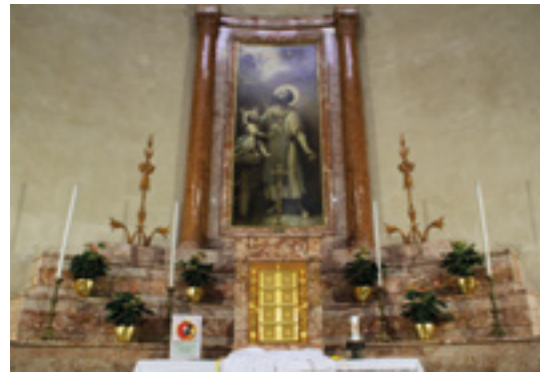
sopra Altare di San Giuseppe, Chiesa S. Maria Nascente a Meda