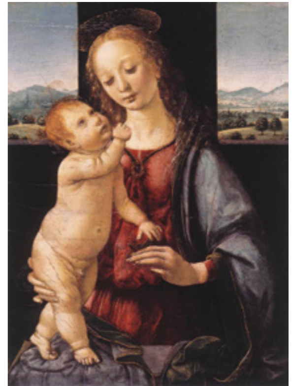
sopra Lorenzo di Credi - Madonna detta Dreyfus [circa 1480]